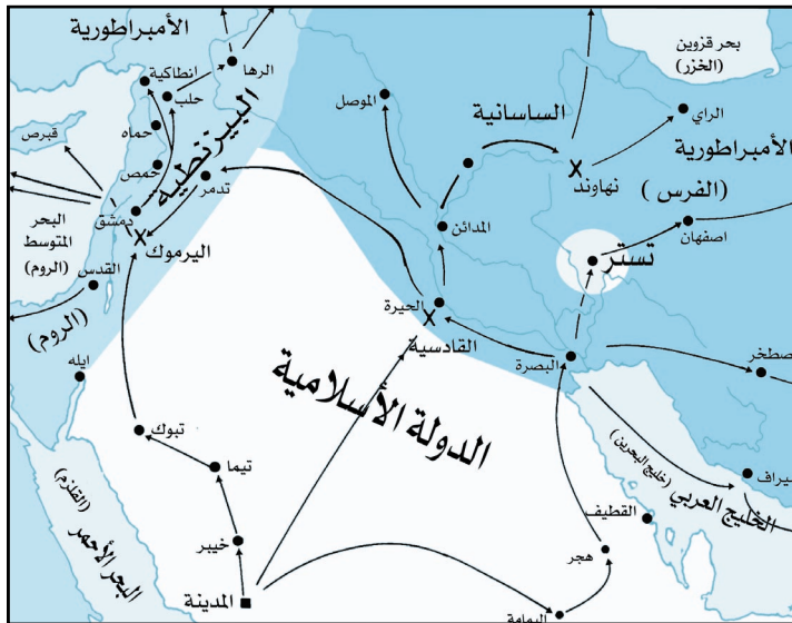
موقعة تستر (الفتوحات الإسلامية)

استمرت دعوة الإسلام في الانتشار حتى بلغت أيام عمر بن الخطاب إلى مشارف فارس، ففي سنة عشرين للهجرة توجه جيش المسلمين إلى فتح (تُستَر) وكانت