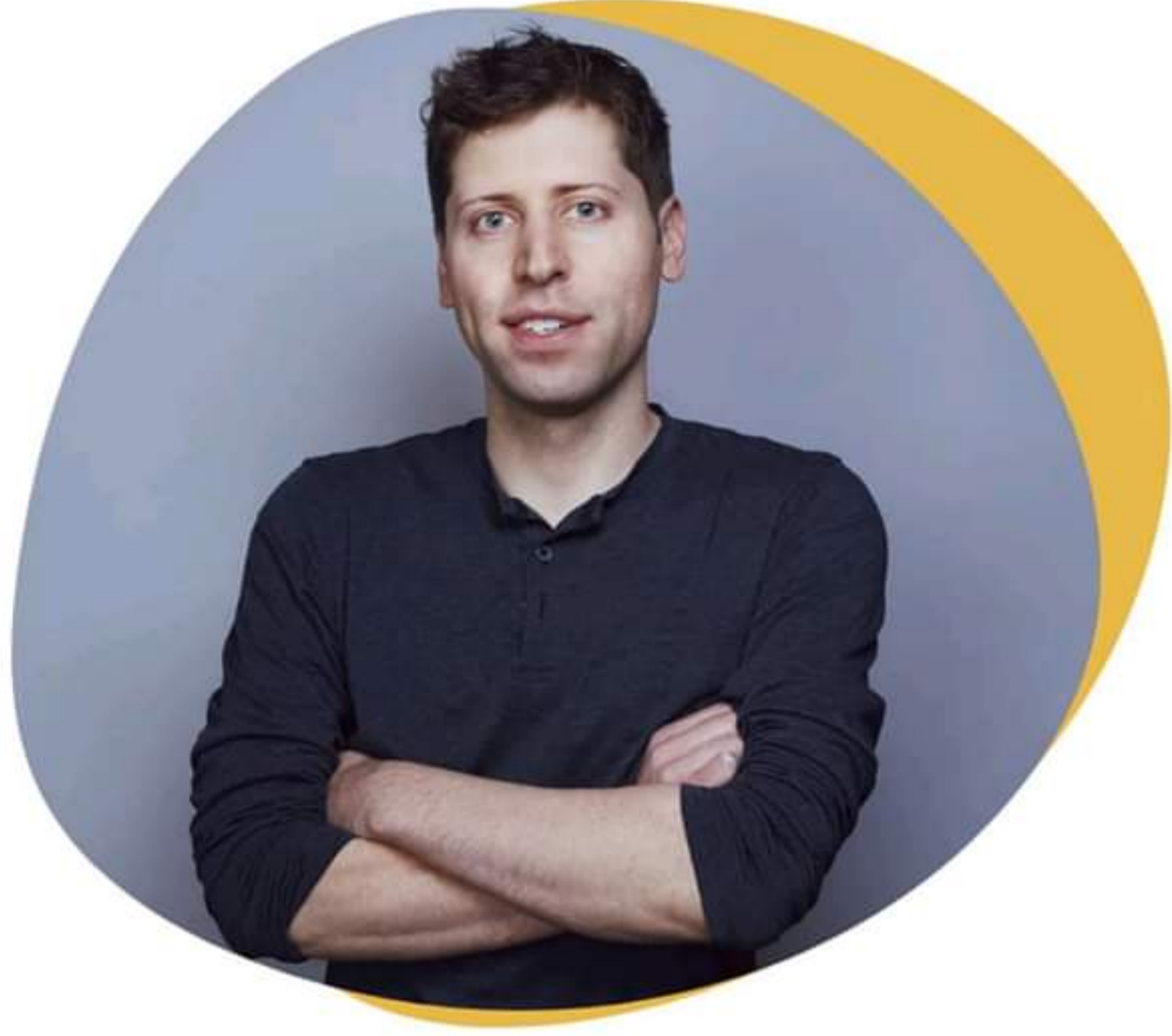
سام ألتمان، مؤسس CHATGPT

إن أدوات الذكاء الاصطناعي ستحدث ثورة في التعليم مثلما فعلت الآلات الحاسبة، لكنها لن تحل محل التعلم