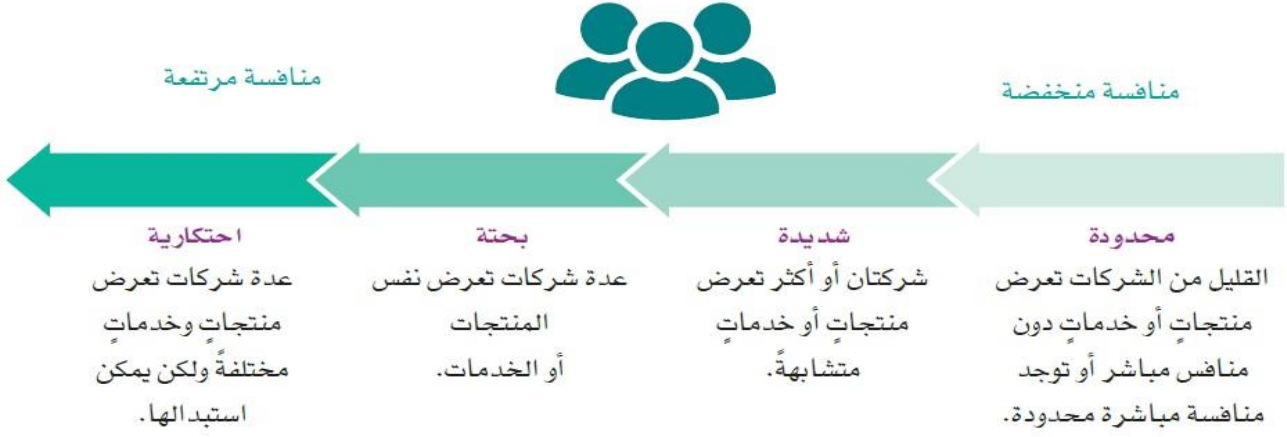
الشكل "4-2" درجات المنافسة