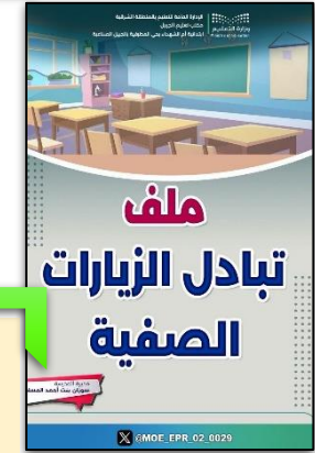
ملف تبادل الزيارات الصفية .