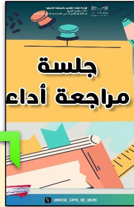
جلسة مراجعة أداء.