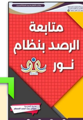
متابعة الرصد بنظام نور.