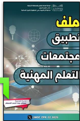
ملف تطبيق مجتمعات التعلم المهنية .