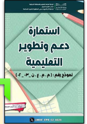
استمارة دعم وتطوير الهيئة التعليمية.