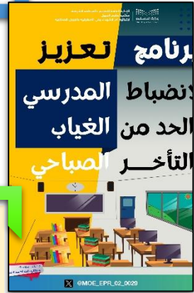
برنامج تعزيز الانضباط المدرسي والحد من الغياب والتأخر الصباحي.