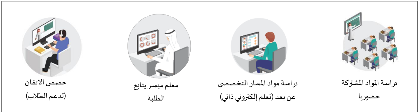
شكل (٢): نموذج الدراسة في برنامج التعليم المدمج

يدرس الطالب المسار التخصصي الإضافي كبرنامج مدمج Blended Program ، حيث تتم دراسة المواد المشتركة بين المسار العام المسكن عليه الطالب والمسار التخصصي حضورياً في المدرسة، ومواد المسار التخصصي غير المشتركة عن بعد (تعلم إلكتروني ذاتي عن طريق المقررات الإلكترونية المعيارية في منصة مدرستي تحت إشراف معلم ميسر)، مع الاستفادة من حصص الاتقان لتقديم دروس داعمة للطلاب في حال توفر المعلم المتخصص.