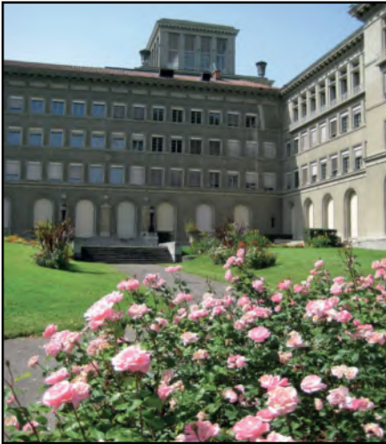
منظمة التجارة العالمية

منظمة التجارة العالمية منظمة متعددة الأطراف، تقوم بدور الإشراف على التجارة الدولية وتشجيعها، وقد تم إنشاؤها في يناير 1995م ومقرها في جنيف بسويسرا، وقد تبنت جميع مبادئ واتفاقيات الجات، علاوة على ثلاثين اتفاقية جديدة، ويبلغ عدد أعضاء المنظمة حتى عام 2017م 164 دولة.