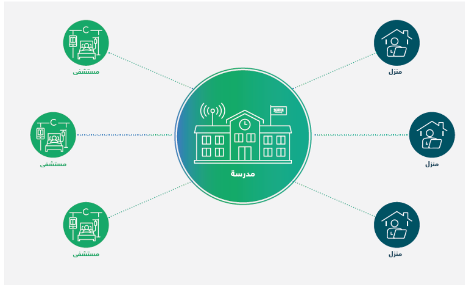
الشكل (1) آلية تعلم الطلبة ذوي الظروف الصحية.

التعليم المتزامن: يتطلب النموذج حضور الطلبة دروسًا متزامنة لكل من المواد الدراسية التالية: اللغة العربية، واللغة الإنجليزية، والعلوم، والرياضيات؛ وذلك مرة واحدة كل أسبوعين (الجدول 1)؛ مراعاةً لظروفهم الصحية، حيث يشاركون في حصص بعض هذه المواد أو كلها - حسب قدرة الطالب - خلال اليوم الدراسي؛ لتعزيز التفاعل المباشر والتعاون مع أقرانهم والمعلمين في الفصل الافتراضي. ويقدم المعلمون في الحصص الدراسية المتزامنة شروحات للمفاهيم العلمية الصعبة، وتحديد المهام في المشاريع الجماعية، وتحفيز الطلبة، وإدارة المناقشات، وتوفير الفرص للطلبة لتطبيق ما تعلموه، وتقديم التغذية الراجعة الفورية، وتسجيل الحصص المتزامنة ورفعها على المنصة لمن يتعذر حضورهم.