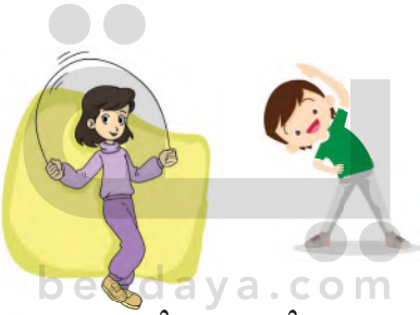
الْأَلْعَابُ الْبَدَنِيَّةُ الْمُفِيدَةُ.

أَعْمَالٍ أُخْرَى، أَكْتُبُهَا ..... الْخِيَاةُ - السِّيَاةُ