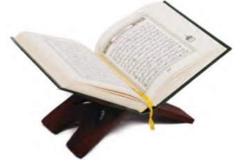
الْقِرَاءَةُ الْمُفِيدَةُ كَحِفْظِ الْقُرْآنِ وَقِرَاءَةِ الْقِصَصِ.