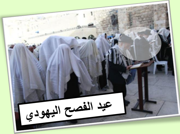
عيد الفصح اليهودي