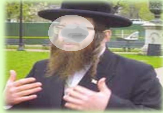
لليهود أعيادهم ..