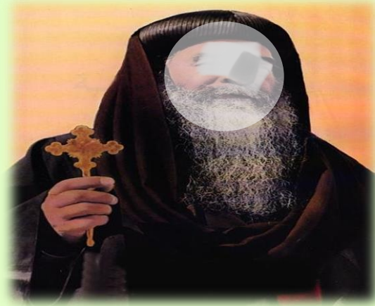
وللنصارى أعيادهم ..