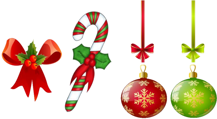
اللون الأحمر والأخضر