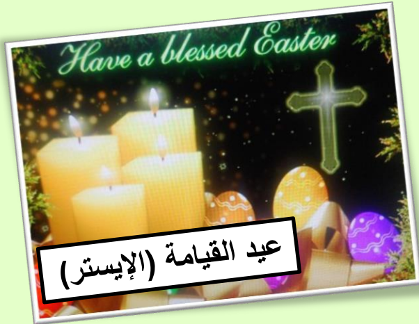
عيد القيامة (الإيستر)