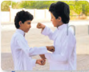
التشاجر مع الآخرين