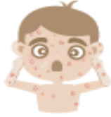
جُدْرِي المَاءِ (المنقز)