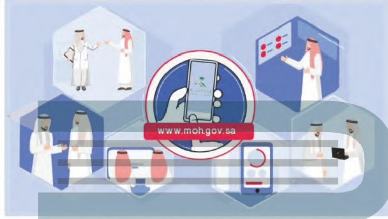
الشكل (1-6) نصائح لتجنب مصادر المعلومات الصحية غير الموثوقة المنتشرة في الإنترنت.

يجب اتخاذ احتياطات عديدة عند البحث عن معلومات صحية عبر الإنترنت، وذلك نظراً لصعوبة توثيق مصادر المعلومات الإلكترونية من جهة، وضعف الرقابة التخصصية على محتوى تلك المصادر. وإليك بعض النصائح؛ لتحسين موثوقية مصادر المعلومات الإلكترونية بشكل عام أثناء البحث عن المعلومات الصحية عبر الإنترنت: