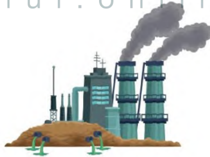
الشكل رقم (1-1): انبعاث الغازات من أحد

تتضمن عافية المحيط البيئي، الذي يؤثر على الحالة الصحية للفرد. وترتكز العافية البيئية على سبل المحافظة على البيئة المحيطة، واتخاذ إجراءات تحمي المجتمع المحلي والعالم الخارجي من التلوث البيئي، الذي يشمل: تلوث الهواء، والمياه، والغذاء، والتعرض لنسبة عالية من الأشعة فوق البنفسجية، والتدخين السلبي، والضوضاء.