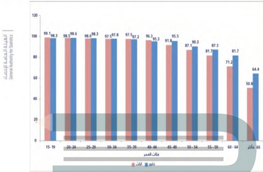
الشكل رقم (3-1) نسبة السكان الذي يتمتعون بحالة صحية جيدة إلى جيدة جداً حسب التقييم الشخصي

وأظهرت نتائج المسوح الصحية الصادرة عن الهيئة العامة للإحصاء في المملكة العربية السعودية البيانات الموضحة في الشكل (3-1).