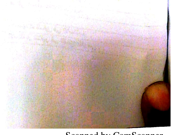
Scanned by CamScanner