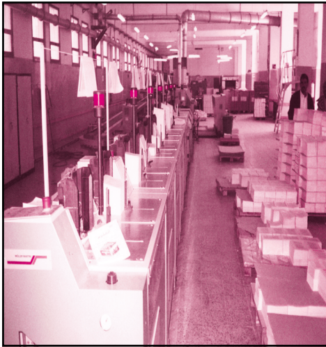
صورة مطابع الكتاب المدرسي

وفي الوقت الحاضر غدت الطباعة أكثر سهولة ويسراً بفضل استخدام الحاسوب في صف الحروف والكلمات، وفي تخزين المعلومات واستعادتها مما ساعد على سرعة الإنجاز وإتقان العمل واختصار الوقت .