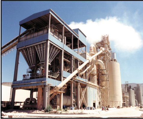
مصنع أسمنت عمران

تمتازُ بلادناُ بوجودِ ثرواتٍ غنيةٍ ومتنوعةٍ بما أودعَ اللهُ فيها من خيراتٍ كثيرةٍ ومنها: النفطُ والغازُ والذهبُ والفضةُ والحديدُ والنحاسُ وغيرها، والتي تمَّ اكتشافُها مؤخراً بعدَ جهودٍ طويلةٍ ومضنيةٍ، فأصبحتْ تمثلُ الخاماتِ الأساسيةَ للصناعاتِ المتعددةِ في بلادنا.