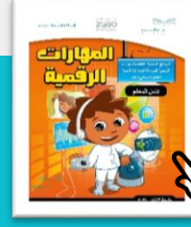
المهارات الرقمية الصف الرابع الابتدائي