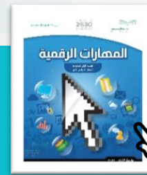
المهارات الرقمية الصف الأول المتوسط