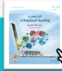
الحاسب وتقنية المعلومات الصف الثالث المتوسط