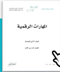
المهارات الرقمية الصف الثاني المتوسط