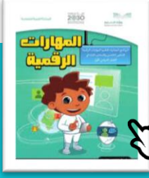
المهارات الرقمية الصف الخامس والسادس الابتدائي