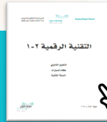
تقنية رقمية ١-٢ الصف الثاني الثانوي