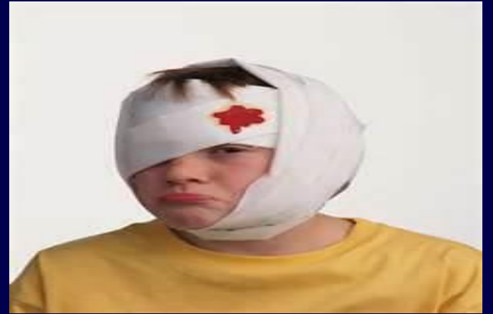
طفلة لديها استشارة قرع الرأس