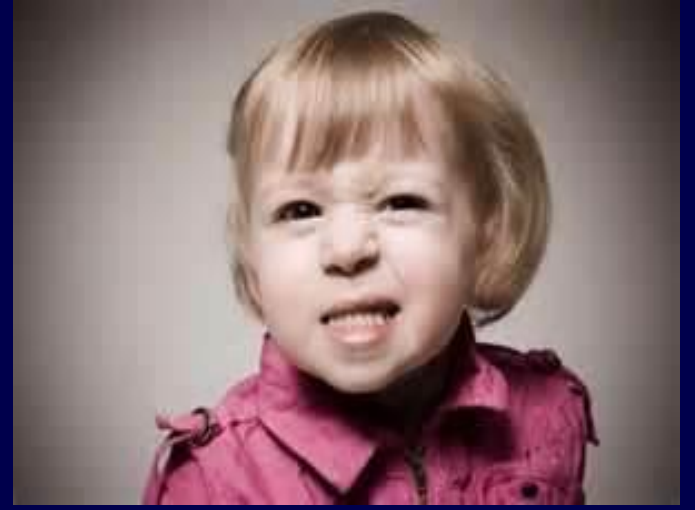
طفلة لديها استشارة قرص الأسنان