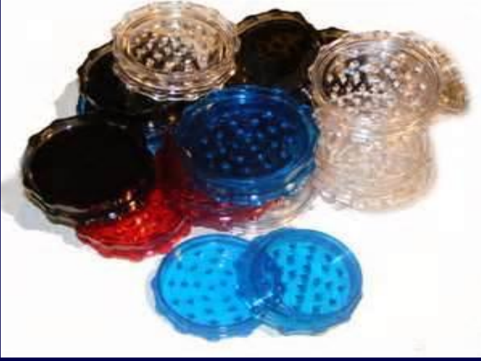
استخدم العضاضة البلاستيكية