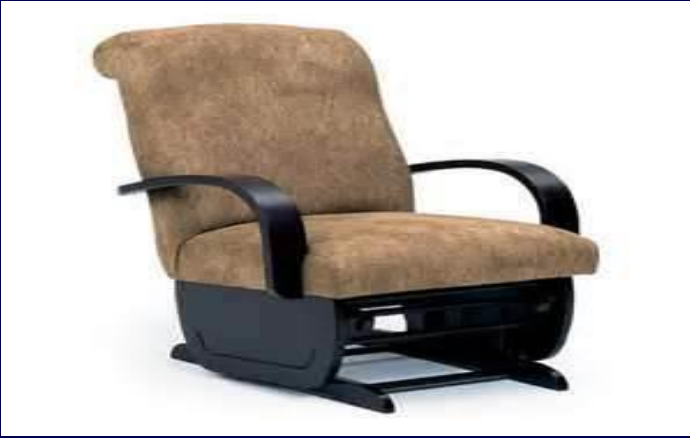
استخدم الكرسي الهزاز لحياته