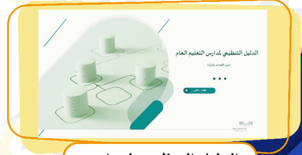
الدليل التنظيمي لمدارس التعليم العام دليل الأهداف والمهام