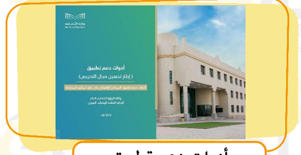
أدوات دعم تطبيق إطار تحسين مجال التدريس