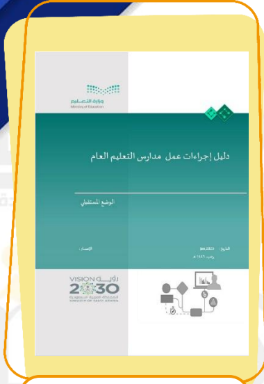
الدليل الإجرائي لمدارس التعليم العام رجب ١٤٤٦هـ