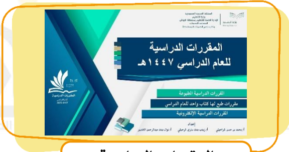
المقررات الدراسية للعام الدراسي ١٤٤٧هـ