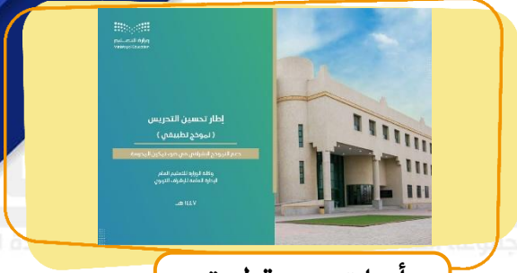
أدوات دعم تطبيق نموذج تطبيقي