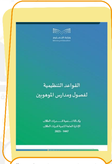
دليل القواعد التنظيمية لفصول ومدارس الموهوبين للعام الدراسي ١٤٤٧هـ