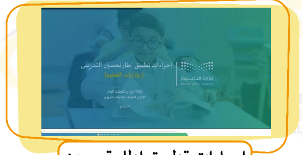
إجراءات تطبيق إطار تحسين التدريس بإدارات التعليم