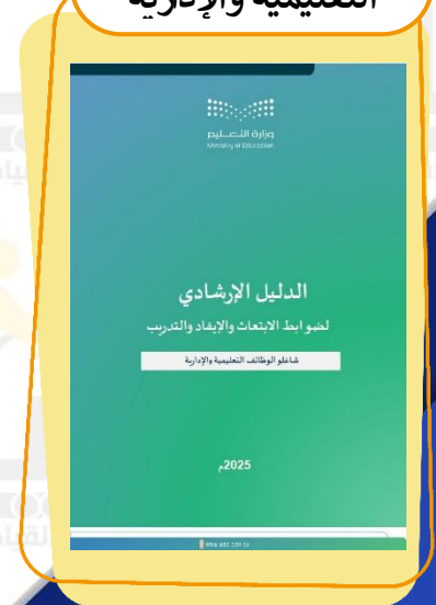
الدليل الإرشادي لضوابط الابتعاث والإيفاد والتدريب شاغلو الوظائف التعليمية والإدارية