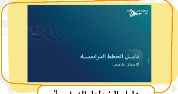
دليل الخطط الدراسية الإصدار الخامس