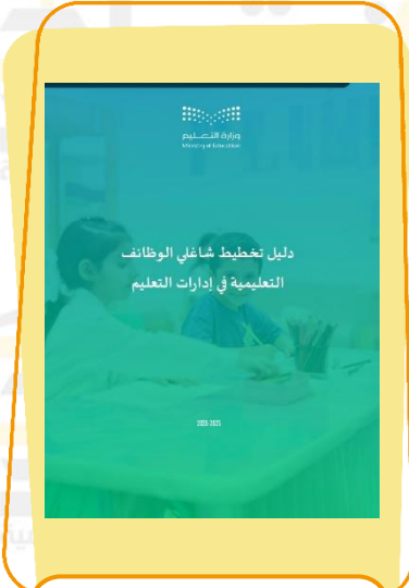
دليل تخطيط شاغلي الوظائف التعليمية في إدارات التعليم