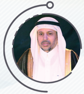
أ.د. عبدالرحمن اليوبي معالى مدير الجامعة

سيروا على بركة الله واستعينوا بالله تعالى على كل ما يعيق أهدافكم وآمالكم، متمنياً لكم جميعاً التوفيق والسداد،