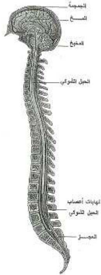
الجهاز العصبي المركزي

١- الجهاز العصبي المركزي Central Nervous System: ويتكون هذا الجهاز