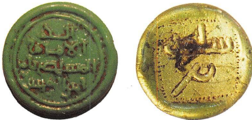
صورة توضح شكل الصنح الزجاجية

صنح الزجاج توضع لوزن الدنانير والدرهم والجواهر الثمينة وذلك لحفظ الوزن ثابتاً . والزجاج في تلك الايام احسن مادة لهذا الغرض اذ لا تتأثر فيه الرطوبة مما يوجب اختلاف الوزن ، وهناك أنواع كثيرة من الصنح تتميز بمواصفات خاصة من اوزان الزجاج ، ففي مصر ترزن ١٣ حبة خروبة kharrubas وقد ألفت كتب في الصنح منها مانشره ( ستانلي لين بول ) ، وفي المتحف العراقي عدد منها احدها باسم عبد الملك وقد نشر بعضها الاستاذ ناصر النقشبندي في كتابه الدينار الاسلامي ص ١٩٣ رقم ١٢٣٠١ - م ع والآخر رقم ٨١٤٠ - م ع