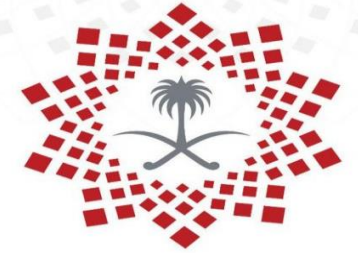
برنامج جودة الحياة 2020