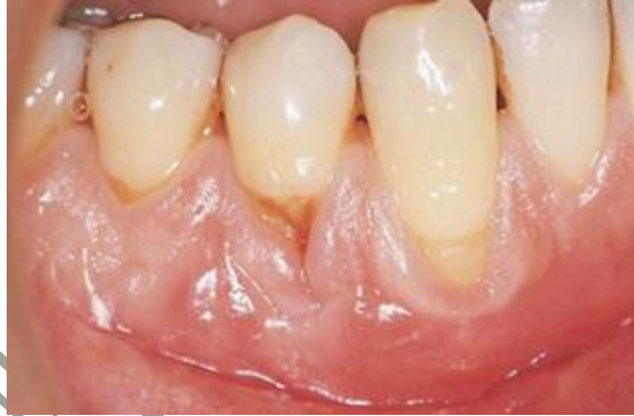
طيات ميكول McCall festoons

ترتبط التغيرات في محيط اللثة في المقام الأول بالضخامة اللثوية ، لكن هذه التغييرات قد تحدث أيضاً في ظروف أخرى مثل شقوق ستيلمان Stillman's clefts