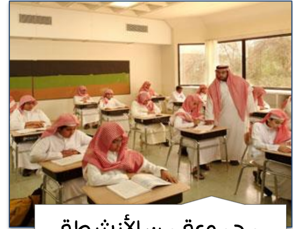
مجموعة من الأنشطة والعلاقات الإنسانية الجيدة