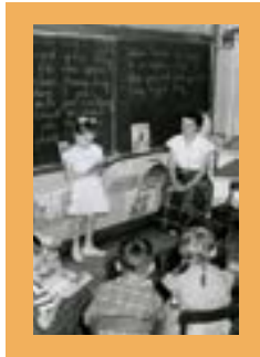
التدريب في الجامعة

هذا إلي يطلبه سوق العمل، يرغب بتوظيف شخص يمتلك المهارة، وبطبيعة الحال ماراج تكتسب أي مهارة من دون ممارسة سابقة، وتجي الخبرة عن طريق: