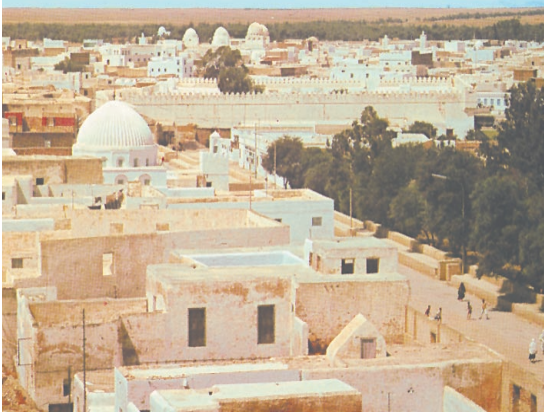
صورة مدينة القيروان / جامع عقبة بن نافع

في غابة الزيتون، ومعبر الحضارات، ونافذة العرب على أوروبا في تونس الخضراء. هذه الأرض الطيبة الممتدة في موقع القلب من ساحل الشمال الإفريقي، حيث عطر الحقول، وأريج الهضاب، وانتعاشة