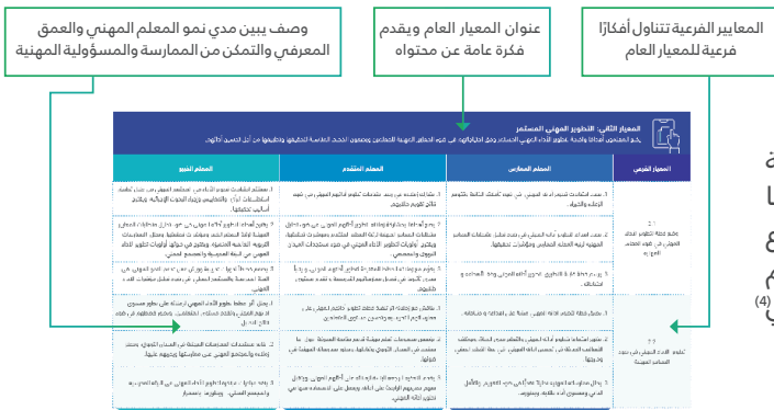
الشكل رقم (3) وصف مكونات المعايير المهنية للمعلمين

ويمثل الشكل رقم (3) وصفاً لمكونات المعايير المهنية التربوية للمعلمين