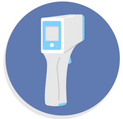
Check body temperature