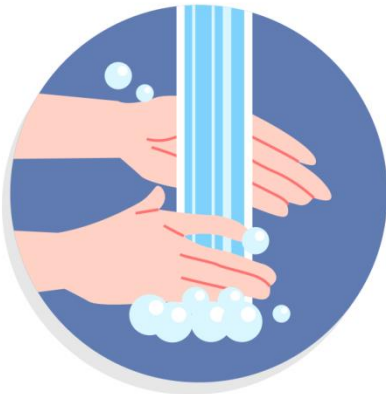
Wash hands with soap