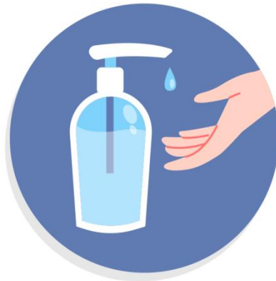
Clean hands with sanitizer