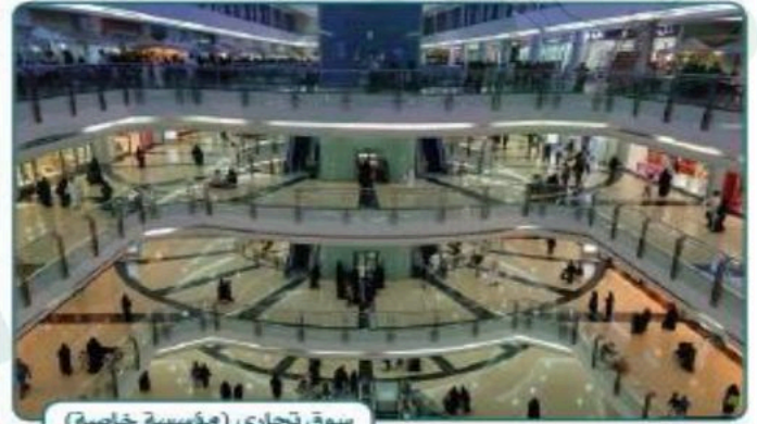
سوق تجاري (مؤسسة خاصة)