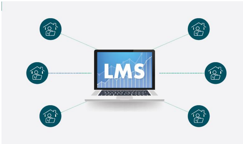
الشكل (1) آلية التعليم في نموذج التعليم الإلكتروني للانتقال من التعليم الحضوري إلى التعليم عن بُعد في الحالات الطارئة

يتطلب النموذج حضور الطلبة دروساً متزامنة؛ للاستفادة من شرح المعلم، وتعزيز التفاعل مع أقرانهم. ويقدم المعلم في الحصص الدراسية المتزامنة شروحاً للدروس، ويعزز من تفاعل الطلبة، ويُحَقِّقهم، ويقدم التغذية الراجعة، ويتم تقييم تعلم الطلبة عبر اختبارات حضورياً؛ وفق الضوابط المحددة في اللوائح المعتمدة لوزارة التعليم (الشكل 1).