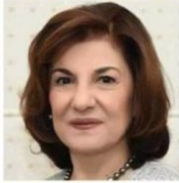
د. بثينة شعبان