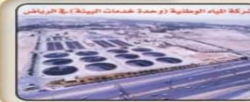
شركة المياه الوطنية (مركز خدمات البيئة) - الرياض