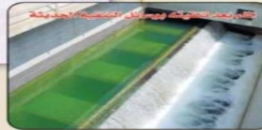
تطهير المياه بوسائل التنقية الحديثة