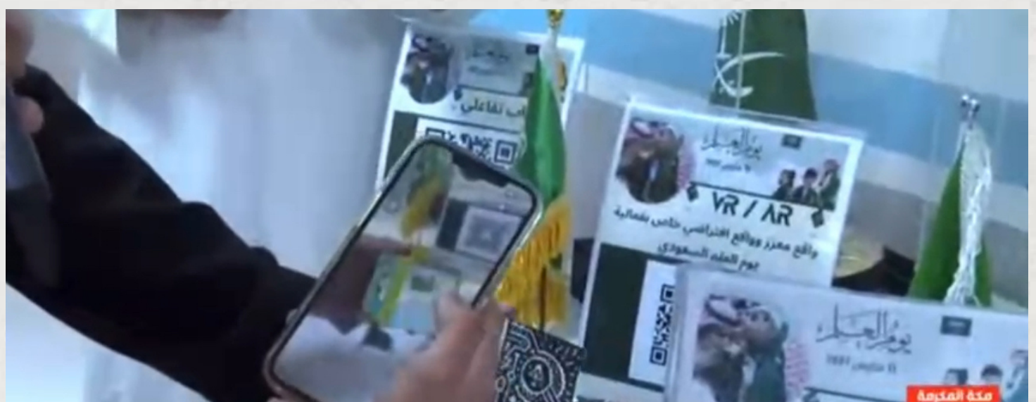
مدارس "تعليم مكة" تحتفي بيوم العلم بفعاليات وبرامج متنوعة | الأولى الاحبارية مكة المكرمة