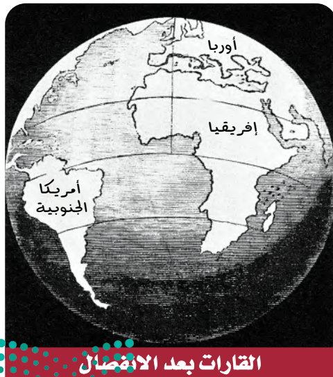
القارات بعد الانفصال

✓ ماذا قرأت؟ استنتج ما الذي جعل رسامي الخرائط من أوائل الذين اقترحوا أن القارات كانت متصلة معاً يوماً ما؟