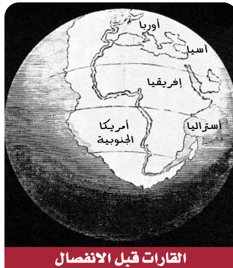
القارات قبل الانفصال

لاحظ العديد من العلماء وجود تطابق الحواف القارية، ومن بينهم رسام الخرائط إبراهيم أورتيلىوس الذي لاحظ تطابقاً بين حافات الغازات على جانبي المحيط الأطلسي فاقترح أن القارتين الأمريكيتين الشمالية والجنوبية قد انفصلتا عن قارتي أوروبا وإفريقيا بسبب الزلازل والفيضانات.