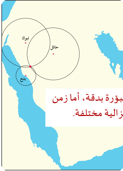
زمن حدوث الزلزال في البؤرة بدقة، أما زمن الوصول إلى الأمواج الزلزالية مختلفة.

الشكل 30-6 لتحديد موقع المركز السطحي للزلزال يحدد العلماء مواقع محطات الرصد على خريطة، ويرسمون حول كل محطة دائرة مركزها المحطة ونصف قطرها بُعد المركز السطحي عن المحطة، وتتقاطع الدوائر جميعها في نقطة تمثل المركز السطحي للزلزال.