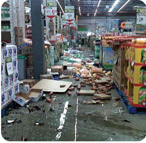
الشكل 28-6 يمكن أن يقيس مقياس ميركالي الأضرار التي يحدثها الزلزال، كالتي في الشكل، وهو زلزال قوي قادر على إيقاع المواد الموجودة على الرفوف.

مقياس العزم الزلزالي Moment magnitude scale رغم أن مقياس رختر يُستعمل لوصف قوة الزلازل، إلا أن معظم العلماء يستعملون مقياس العزم الزلزالي Moment magnitude scale ، وهو مقياس رقمي يشير إلى الطاقة المتحررة من الزلزال، مأخوذاً في الاعتبار حجم الجزء المتمزق من الصدع، ومقدار الحركة على طول الصدع، وقساوة الصخر.