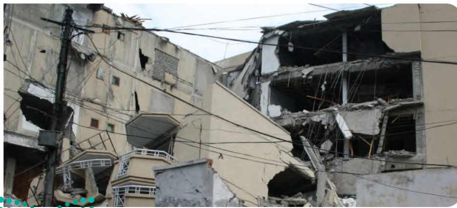
الشكل 27-6 دمار ناجم عن زلزال قوته 7.6 درجة على مقياس رختر، وهو زلزال قوي ضرب باكستان في شهر يناير من عام 2005 م.

مقياس رختر Richter scale ابتكر مقياس رختر Richter scale الجيولوجي تشارلز رختر Charles Richter، وهو مقياس عددي يقيس طاقة أكبر الأمواج الزلزالية المنبعثة من الزلزال، ويسمى مقدار الطاقة هذا قوة الزلزال Magnitude . وتقاس قوة الزلزال بإيجاد سعة الموجة الزلزالية Amplitude . وهي ارتفاع الموجة الزلزالية الأكبر، حيث تشير كل درجة على مقياس رختر إلى زيادة في سعة الزلزال قدرها 10 أضعاف الدرجة التي قبلها، فمثلاً، سعة الأمواج الزلزالية لزلزال قوته 8 بحسب مقياس رختر أكبر عشر مرات، من سعة الأمواج الزلزالية لزلزال قوته 7. لكن الفرق في كمية الطاقة الصادرة عن الزلازل أكبر كثيراً من الفرق في سعة الأمواج الزلزالية؛ فالطاقة الزلزالية الصادرة عن زلزال عند درجة ما أكبر 32 ضعفاً من الطاقة الصادرة عن الدرجة التي تسبقها، لذا فطاقة الزلزال الذي قوته 8 أكبر 32 مرة من طاقة زلزال قوته 7. ويوضح الشكل 27-6 دماراً سببه زلزال قوته 7.6 درجة على مقياس رختر.