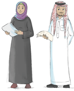
المهتمون بالتعليم بشكل عام