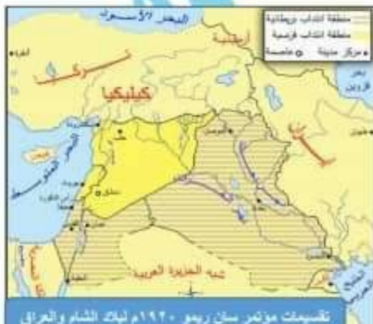
تقسيمات مؤتمر سان ريمو ١٩٢٠م لبلاد الشام والعراق