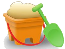
المحافظة على أدوات الرمل