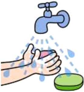
غسل اليدين بعد الانتهاء من اللعب