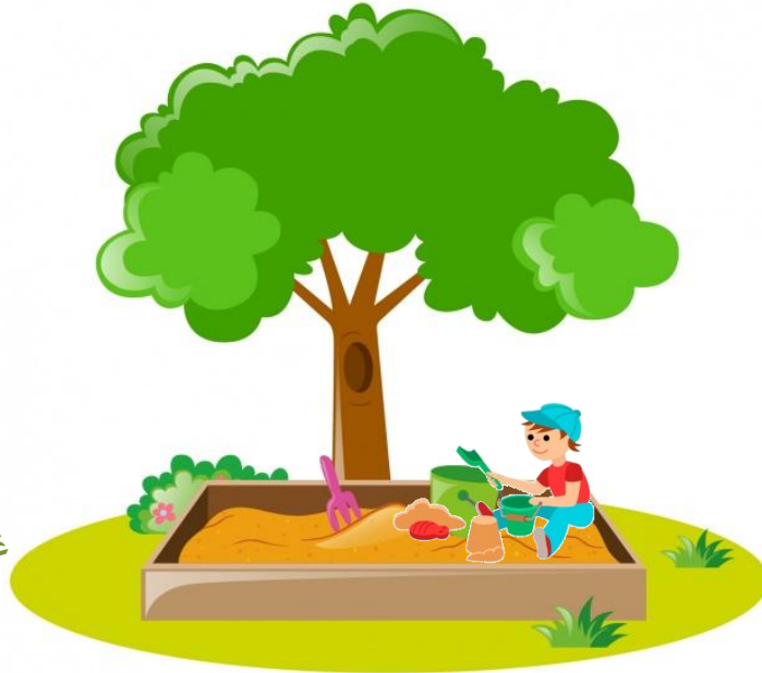
التعامل مع الرمل بهدوء