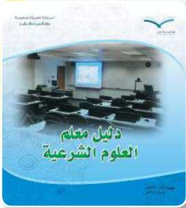
دليل معلم العلوم الشرعية

أولاً: هذا الدليل مكملٌ لدليل معلم العلوم الشرعية يستفاد منه في الموضوعات الآتية: (المعلم القائد- تعرف طلابك - تخطيط الدرس- تنفيذ الدرس).