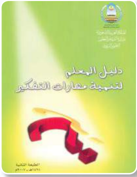
دليل المعلم لتنمية مهارات التفكير

ثانياً: يحسن الاطلاع على كتاب دليل المعلم لتنمية مهارات التفكير ويستفاد منه في الموضوعات الآتية: (مصطلحات التفكير- مهارات التفكير- استراتيجيات تعليم التفكير وطرائقه - نماذج تطبيقية في تعليم مهارات التفكير).