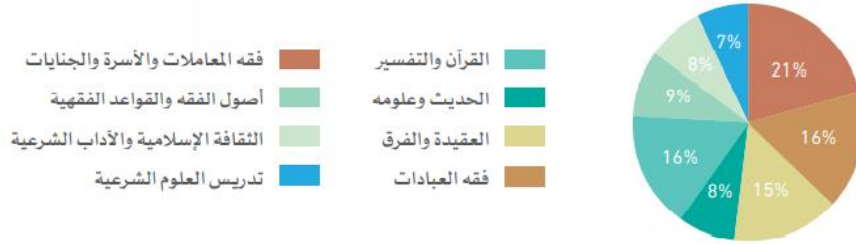
شكل (١) الوزن النسبي لمجالات معايير التربية الإسلامية

ويبين الشكل (١) نسب تمثيل المجالات مفضلة، وفقا لوزنها النسبي الموضح بالشكل، فعلى سبيل المثال: يمثل الفقه بفروعه المختلفة ٤٤% من محتوى المعايير، و القرآن الكريم وعلومه ١٦%، والحديث وعلومه ٨%، وهكذا بقية المجالات. وقد روعي في هذا التقسيم محتوى المناهج الدراسية التي تدرس في التعليم العام.