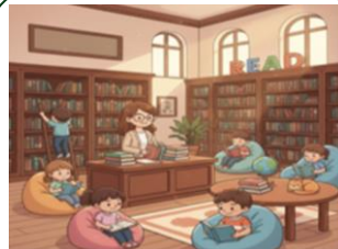
We read many books in the _____.