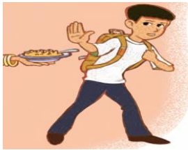
We eat _____ in the morning.