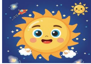
The _____ is bright and yellow in the sky.