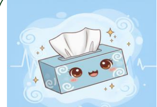
I use _____ to clean my nose.