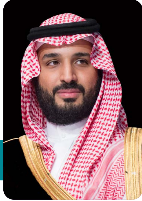
سمو ولي العهد الأمير محمد بن سلمان بن عبدالعزيز آل سعود (حفظه الله)