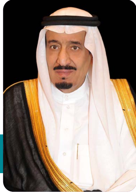
خادم الحرمين الشريفين الملك سلمان بن عبدالعزيز آل سعود (حفظه الله)