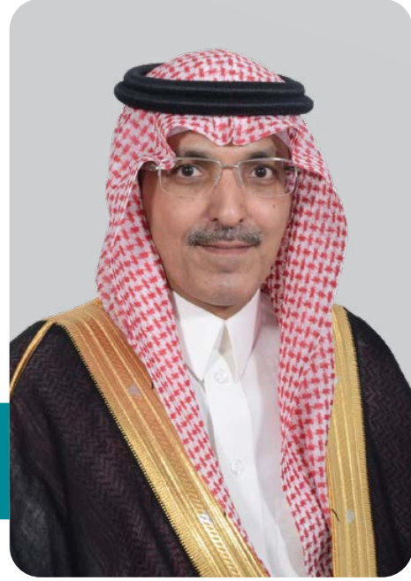
وزير المالية محمد بن عبدالله الجدعان