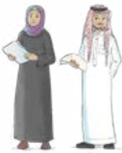
المهتمون بالتعليم بشكل عام