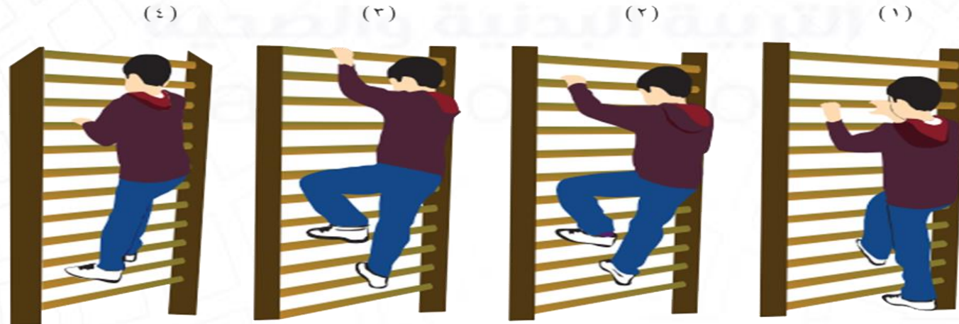
تسلق عقل الحائط