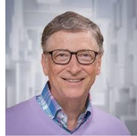
Bill Gates مبرمج نظم