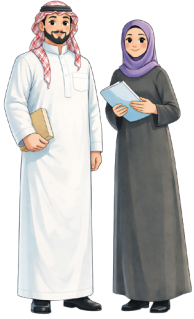
المهتمون بالتعليم بشكل عام