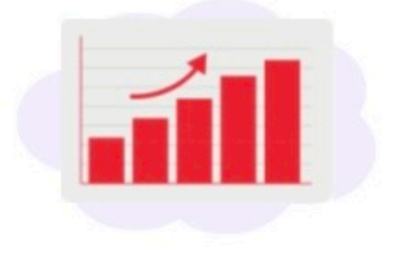
أوراق العمل التفاعلية