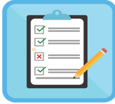
استبانة ولي الأمر