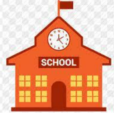
ملاحظة البيئة المدرسية