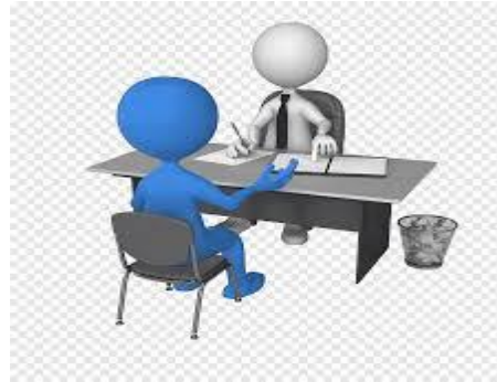
مقابلة الموجه الطلابي