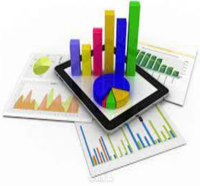
استبانة تحليل النتائج

فضلا اضغط على الصورة ليظهر لك المستند ((ولا تنسوا تعديل الكليشة))