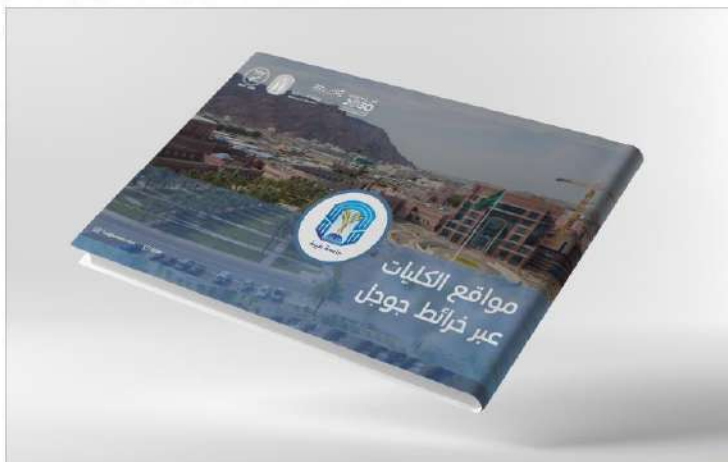
مواقع الكليات عبر خرائط قوقل