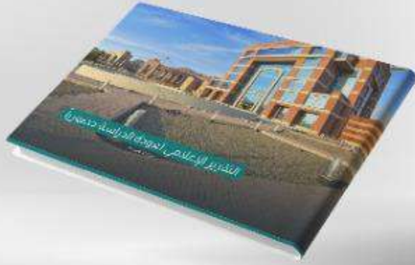
التقرير الاعلامي لعودة الدراسة حضوريا