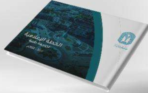
الخطة الاعلامية لجامعة طيبة