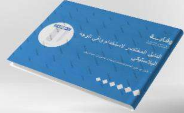
الدليل المختصر لاستخدام واقي الوجه البلاستيكي