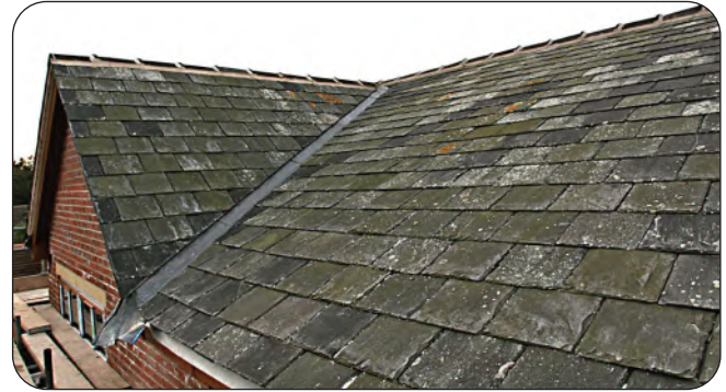
الشكل 4-73 الرخام والأردواز صخران متحولان استعملتا في البناء منذ قرون.