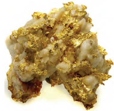
الشكل 36-4 تتكون عروق الذهب في الكوارتز عندما يبرد المحلول الحراري المائي.

أدى نمط الحياة الحديث إلى ازدياد استخراج واستخدام موارد الأرض الطبيعية. فنحن مثلاً نحتاج إلى الملح للطهي، والذهب للتجارة، وفلزات أخرى للبناء والأغراض الصناعية، كما نحتاج إلى الوقود الأحفوري للطاقة، وإلى الصخور والعديد من المعادن في المستحضرات التجميلية، إلى غير ذلك من الاستعمالات. ويوضح الشكل 37-4 مثالين لكيفية استعمال الصخور المتحولة في البناء. وينتج الكثير من هذه الموارد المعدنية الاقتصادية من عمليات التحول، ومن بينها: فلزات الذهب والفضة والنحاس والرصاص، بالإضافة إلى موارد غير فلزية مهمة وكثيرة.