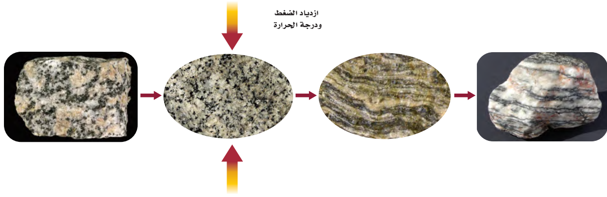
الشكل 33-4 يتطور التورق عندما يؤثر الضغط في اتجاهين متضادين، ويكون التورق متعامداً على اتجاه الضغط.