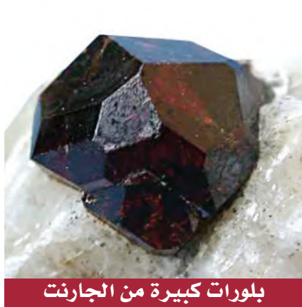
بلورات كبيرة من الجارنت

تختلف الصخور المتحولة غير المتورقة Nonfoliated عن الصخور المتورقة في أنها مكونة من معادن ذات بلورات كتلية الشكل. ويوضح الشكل 34-4 مثالين شائعين على الصخور غير المتورقة، هما الرخام والكوارتزيت. والكوارتزيت صخر قاس، وغالباً ما يكون فاتح اللون، وينشأ عن تحول الحجر الرملي الغني بالكوارتز، بينما ينشأ الرخام عن تحول الحجر الجيري. ونادراً ما تُحفظ الأحافير في الصخور المتحولة. وبعض أنسجة أنواع الرخام ملساء تشكّلت من تداخل حبيبات الكالسيت. وتستعمل أنواع الرخام هذه غالباً في أرضيات المنازل. ويتم استخراج الرخام في المملكة العربية السعودية من عدة أماكن منها جبل خنوقة شمال شرقي عفيف، بينما يستخرج الرخام الأسود من جبل غرور ودمخ شمال غرب حلبان. ويمكن في ظروف معينة أن يكبر حجم المعادن المتحولة الجديدة، بينما تبقى المعادن المحيطة بها صغيرة الحجم. وعلى الرغم من أن هذه البلورات الكبيرة تشبه البلورات الكبيرة جداً في البيجماتيت الجرانيتي، إلا أنها تختلف عنها؛ فبدلاً من أن تتشكّل من الصهارة فإنها تتشكّل في الصخر الصلب من خلال إعادة ترتيب الذرات في أثناء التحول. ويوضح الشكل 34-4 معدن الجارنت الذي تشكل بهذه الطريقة.